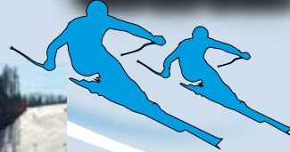
Gigantissimo Parallelo Parallelo giant slalom Parallelo-Riesenslalom