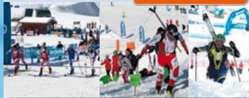
Ski alp sprint race Sprint-Skibergestiegswettbewerb